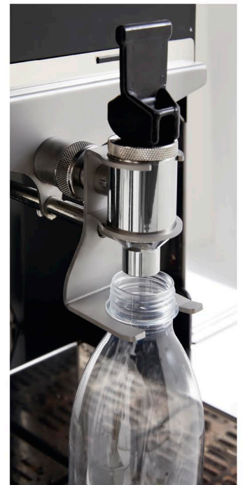
Bottle holder Soporte de botellas Sostegno delle bottiglie