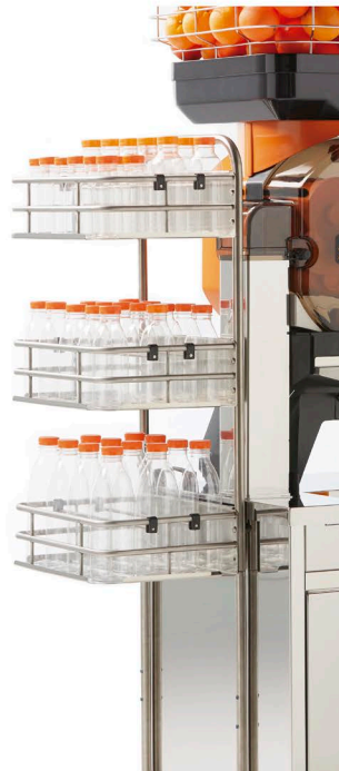
Bottle Rack on cabinet Botellero sobre mueble Portabottiglie sul mobile