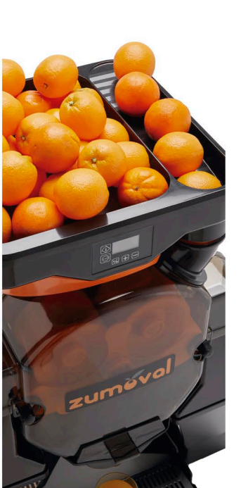
NEW Basic & BigBasic Feeder NUEVO alimentador para Basic y BigBasic NUOVO alimentatore per Basic e BigBasic

Zumoval produce gli spremiagrumi più resistenti e robusti con l'obiettivo di offrire sempre la migliore qualità e affidabilità ai suoi clienti.